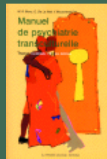
Manuel de psychiatrie transculturelle. M.R. Moro et coll. 448 p., (24€)

Télécopie: (33) 04 76 42 09 32 - Tél. : (33) 04 76 42 09 37 lapenseesauvage@free.fr