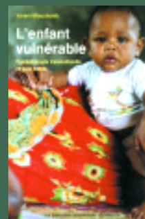
L'enfant vulnérable. Yoram Mouchenik. (23€)