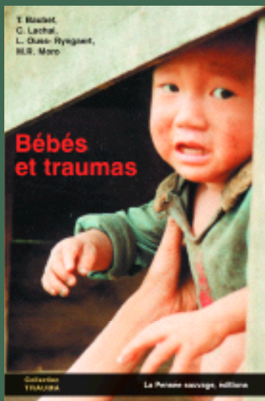
Bébés et traumas T. Baubet, C. Lachal, L. Ouss-Ringaert, M.R. Moro