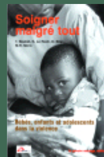
Soigner malgré tout. (T.2) Bébés, enfants et adolescents dans la violence T. Baubet et coll., (20€)