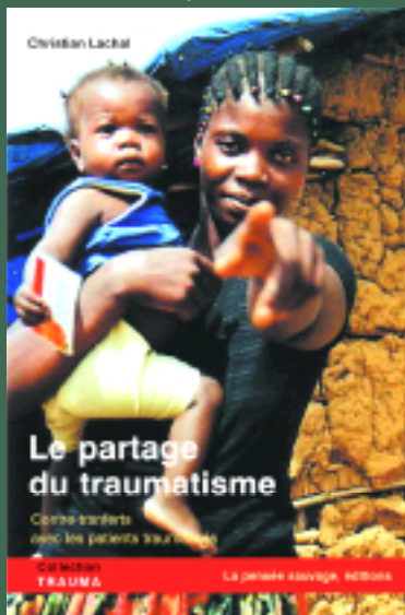
Le partage du traumatisme. Contre-transferts avec les patients traumatisés